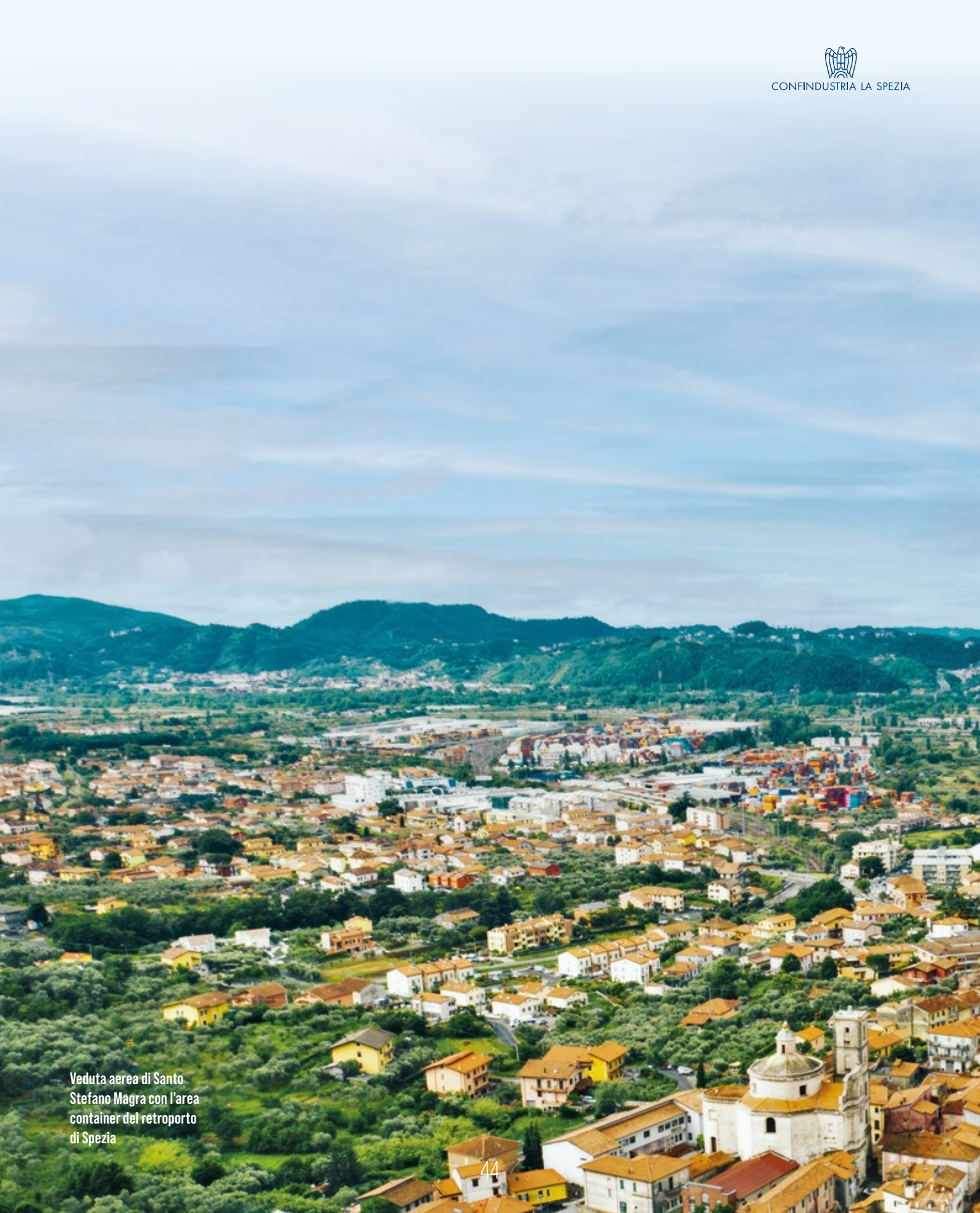
Veduta aerea di Santo Stefano Magra con l'area container del retroporto di Spezia