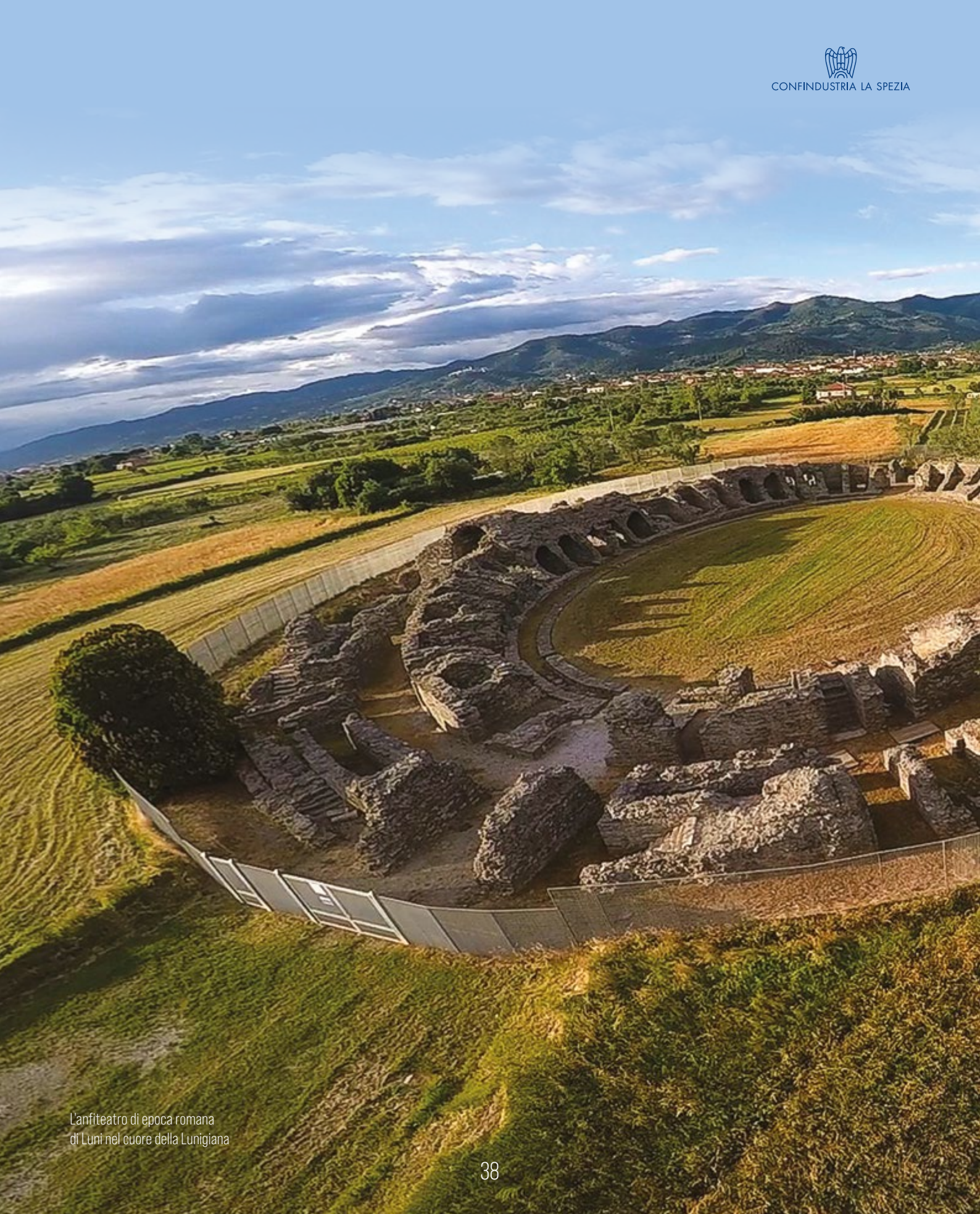
L'anfiteatro di epoca romana di Luni nel cuore della Lunigiana